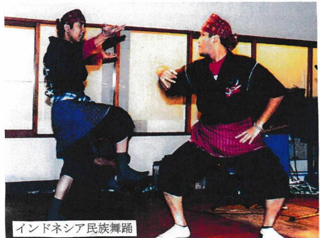
インドネシア民族舞踊