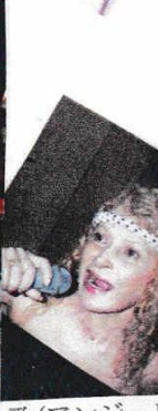
歌(アンジェリカさん)