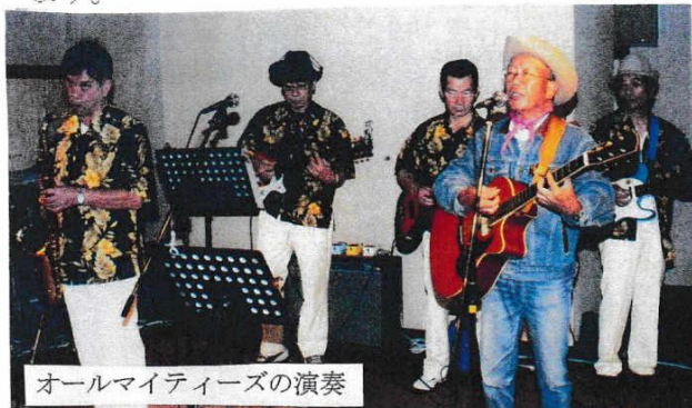
オールマイティーズの演奏

それでも、大勢の観客が集まり、いろいろな国の歌や踊りを楽しんで戴けたのではないかと思っています。