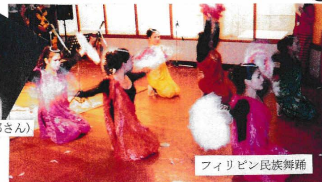
フィリピン民族舞踊