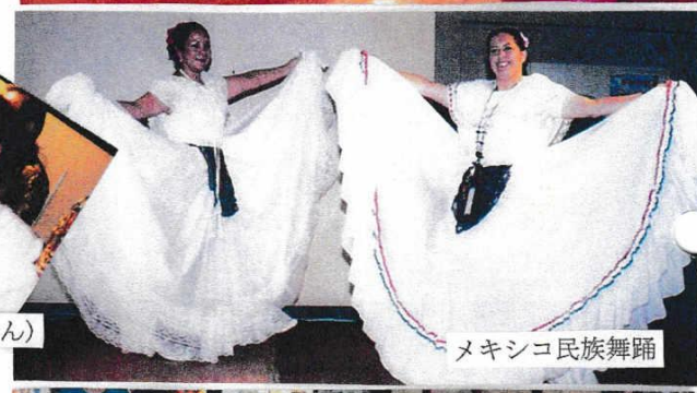
メキシコ民族舞踊