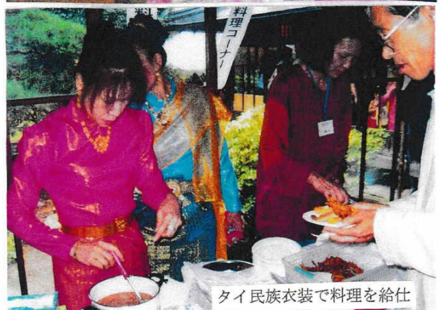
タイ民族衣装で料理を給仕